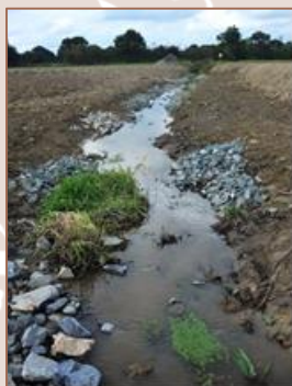
Restauration avant / après sur le site de Bazoug (53)

Il était nécessaire de recréer un lit majeur de 10 à 12 mètres de large au cours d'eau, afin de diversifier les habitats en restaurant ainsi les zones humides qui anciennement bordaient celui-ci et qui étaient alimentées lors des crues biennales.